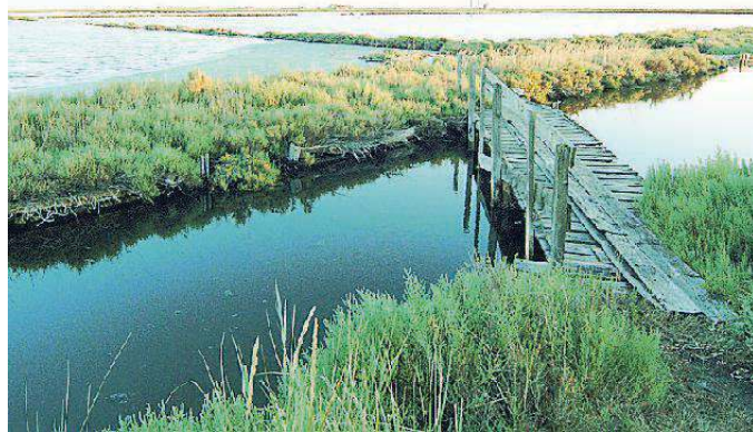
Le saline di Comacchio e il meraviglioso spettacolo dei fenicotteri

Le saline di Comacchio sono un luogo simbolo del Parco Delta del Po. Questa splendida area naturalistica tra Veneto ed Emilia-Romagna di recente ha ottenuto l'importante riconoscimento di Riserva Internazionale di Biosfera Unesco. Abbandonata nel 1984 la produzione del sale - grazie al cui commercio è fiorita economicamente in passato l'intera area - l'ex salina è ormai popolata da moltissime specie di uccelli, anche rari. In particolare, hanno trovato in questi luoghi un habitat adatto a nidificare numerose coppie di fenicotteri rosa, soprattutto grazie alla scarsa presenza umana. Oggi l'area è famosa proprio perché qui vive la seconda più grande colonia stanziale di volatili in Italia dopo quella sarda. Sono moltissimi gli amanti della natura, i birdwatcher o semplicemente le famiglie con bambini che decidono di visitare quest'oasi ambientale per ammirare i fenicotteri nel loro ambiente naturale.