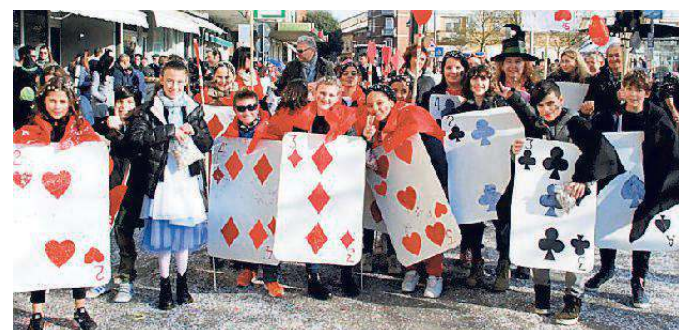
Una delle classi che hanno partecipato al carnevale di Argenta

Erano anni che in occasione del carnevale argentino, non si vedeva così tanta gente in centro ad Argenta. Così pure mai si era arrivati a quota 20 fra gruppi e carri mascherati partecipanti. Sinonimo che, quest'anno, alle scuole elementari, genitori e insegnanti hanno davvero collaborato per coinvolgere i bambini in questa giornata gioiosa. E oltre alle classi che hanno partecipato alla bella festa di ieri, anche l'associazione di Filo "Equilibrium". Va ricordato che, da sempre, il carnevale argentino vede come principali organizzatori i volontari della Polisporti-