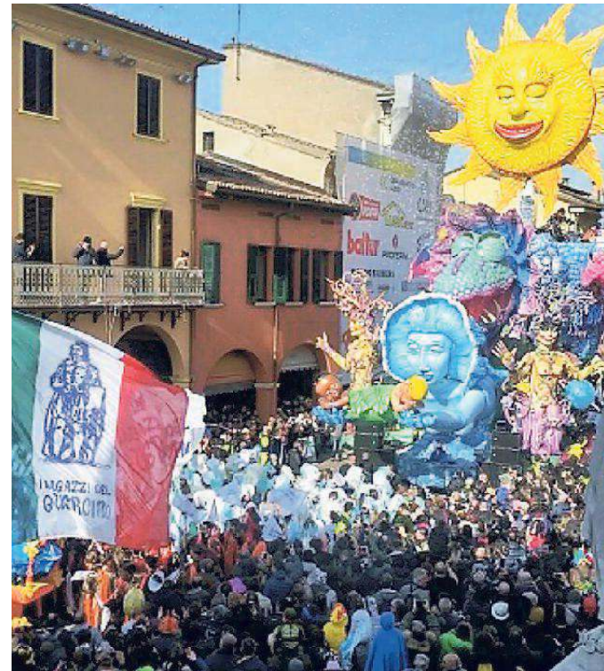
Tanta gente anche ieri a Cento per la terza sfilata del Carnevale d'Europa

mi concreti e di grande interesse come turismo, valorizzazione del territorio e dei prodotti d'eccellenza». Lo spettacolo è proseguito poi con la splendida voce di Deborah Iurato, vincitrice della 13° edizione di Amici e trionfatrice di 'Tale e Quale Show', sul palco col maestro Massimo Zanotti. In pri-