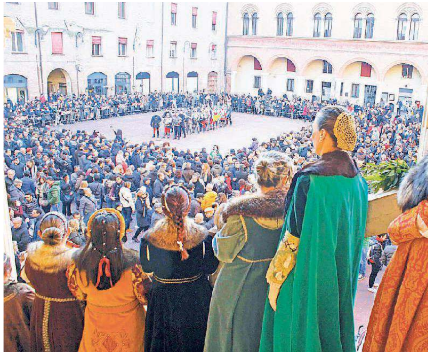
Gli spettacoli di ieri in piazza Municipale a Ferrara, alato foto finale del carnevale di Comacchio

E sono state indubbiamente quattro giornate ricche di appuntamenti e, soprattutto, ricche di persone di tutte le età che, fra spettacoli, conferenze, concerti, banchetti, balli in maschera, laboratori per bambini e tanti altri appuntamenti - in gran parte gratuiti -, all'insegna del divertimento e della cultura, nelle sale degli antichi palazzi di corte e lungo le vie del centro storico, non hanno certo faticato a trovare il modo per celebrare il carnevale e ritrovare lo spirito della Ferrara capitale al tempo degli Estensi. Sì, perché lo spirito con cui è nata questa manifestazione resta l'arma in più del Carnevale rinascimentale promosso, come sempre, dall'amministrazione comunale con il coordinamento del Consorzio Vitis Ferrara , in collaborazione con l'Ente Palio (tantissimi i figuranti che hanno sfilato in centro sabato e riempito piazza Municipale ieri), con il patrocinio di Camera di Commercio, Università di Ferrara, MiBact Polo museale Emilia Romagna ed Associazione ben italiani patrimonio dell'Unesco, oltre a numerosi partner istituzionali ed associazioni culturali della città.