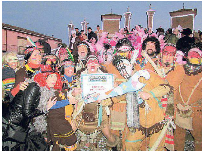
Vince la piroga dei Mohicani portata in scena dalla compagnia "Al Batal"

Dopo un testa a testa tra gli equipaggi in gara, a strappare la vittoria nella sesta edizione del Carnevale sull'acqua, è stata ieri, in un centro preso d'assalto dai turisti, la piroga dei Mohicani, portata in scena dalla compagnia "Al Batal". La simpatica tribù di pellerossa che, facendo il verso ad annonanze in vernacolo, ha denominato la barca "A moi i can" (a mollo i cani), si è aggiudicata la forcola dipinta a mano da Pierluigi Mangherini. Prima classificata, per la categoria gruppi, l'associazione El movimento di Beatrice Cavallari, che ha trasformato la gradinata del Trepponti in un suggestivo set cinematografico "Bollywoodiano", dominato da sinuose danzatrici ed attrici indiane, che hanno scatenato tutti a ballare sulle note di "Occidentali's karma", brano portato in trionfo a Sanremo da Francesco Gabbani. Vinco-