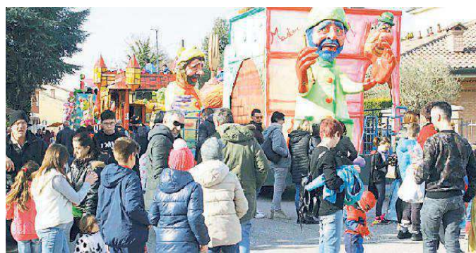
La sfilata dei carri durante il carnevale di Ravalle

L'attrazione infatti per i bambini erano i palloni, i peluches ed i giocattoli che venivano continuamente lanciati dai carri mentre per gli adulti che si davano da fare per acchiappare i gadget, c'erano vino bianco e rosso, pinzini e favini a volontà. I componenti dell'Associazione