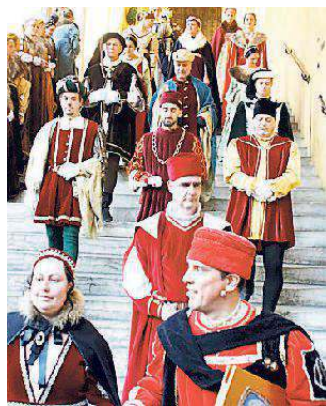
Sfilata sullo scalone ieri a Ferrara

E ieri piazza Municipale era ancora tutta esaurita per la rievocazione dei festeggiamenti nuziali di Eleonora d'Aragona e del duca Ercole I, cerimonia maggiore di chiusura del ricco programma di eventi del carnevale. Una giornata contraddistinta da molte iniziative partecipate, in particolare i due momenti (mattino e pomeriggio) al Museo Archeologico.