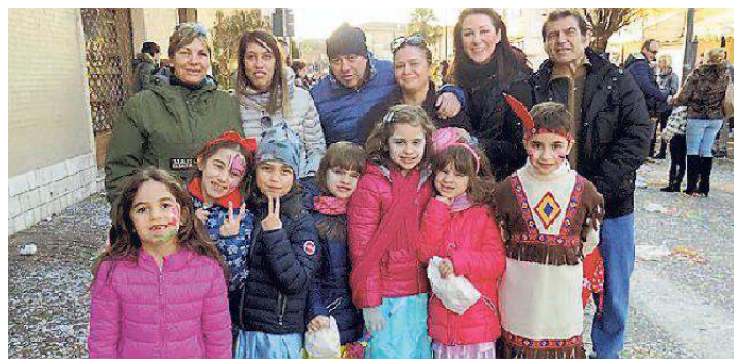
Genitori e bambini al carnevale di Vigarano Mainarda

Grazie alla giornata di sole tanta gente ha preso d'assalto il circuito di piazza della Repubblica per partecipare al Carnevale a Vigarano, con il servizio d'ordine di carabinieri, Polizia municipale e Protezione civile a garantire la piena sicurezza. Bambini assoluti protagonisti in quanto, a loro scelta, con l'assistenza dei caristi di Diamantina potevano salire a piacimento sui carri, per partecipare alle coreografie con balli e canti, oppure seguire il corteo allegorico per raccogliere il getto di pupazzi, palloni e caramelle. Oltre ai carri "Il bruco", "Pinocchio e la Balena" e