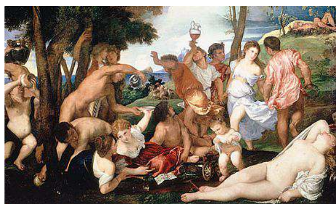
Il Baccanale degli Andrii di Tiziano è stato prestato dal Prado ai Diamanti

Ferrara con lievi ritocchi nel 1521 e una terza volta, sensibilmente rimaneggiato, nel 1532, pochi mesi prima di morire. Negli anni tra la prima e la terza redazione del Furioso il mondo attorno al suo autore cambia radicalmente, a cominciare dagli sconvolgimenti culminati nella battaglia di Pavia del 1525 che segna la sconfitta di Francesco I e l'inizio dell'egemonia politica e culturale di Carlo V sulle corti padane. Il titolo: "Ariosto 500 anni. Cosa vedeva Ariosto quando chiudeva gli occhi". L'esposi-