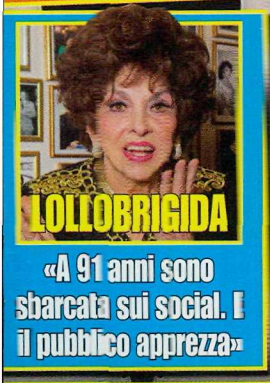
LOLOBRIGIDA «A 91 anni sono sbarcata sui social. Il pubblico apprezza»