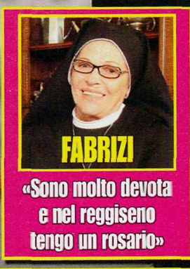
FABRIZI «Sono molto devota e nel reggiseno tengo un rosario»

PAURE VIP Depp odia i clown, la Kidman le farfalle: ecco le fobie delle star