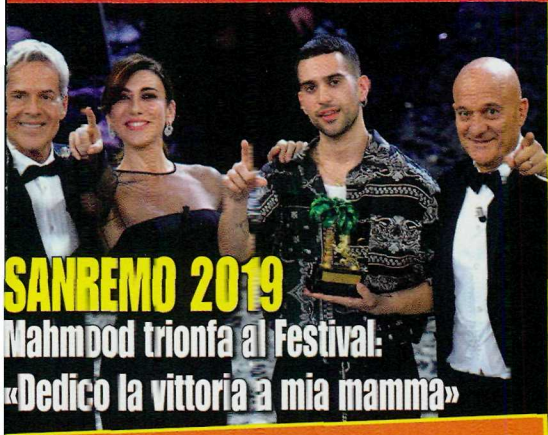
SANREMO 2019 Mahmood trionfa al Festival: «Dedico la vittoria a mia mamma»

sette giorni di notizie, storie e personaggi