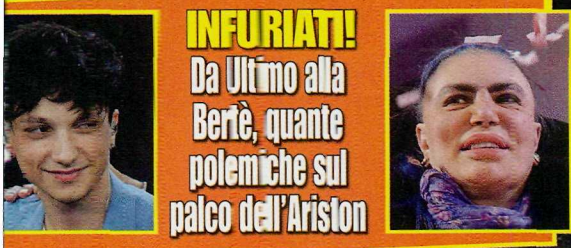
INFURIATI! Da Ultimo alla Bertè, quante polemiche sul palco dell'Ariston