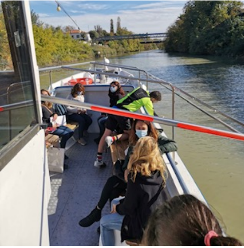
A bordo del battello "Nena" sul Po di Volano

Un'esperienza autentica di "turismo lento" a contatto con la natura, dove la valorizzazione del territorio si basa sul rispetto per l'ecosistema, l'ambiente e le persone. Si parte dalla Darsena di Ferrara sul battello fluviale "Nena" che può ospitare anche le biciclette. Si naviga piacevolmente sul Po di Volano ammirando il paesaggio rurale fino a Sabbioncello San Vittore.