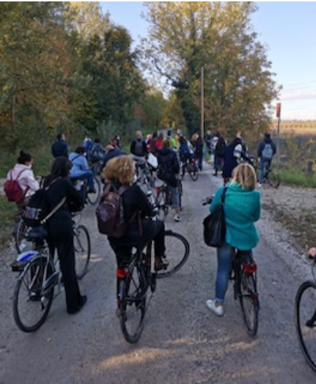
In bici alla scoperta del territorio e delle Delizie Estensi

Un'esperienza autentica di "turismo lento" a contatto con la natura, dove la valorizzazione del territorio si basa sul rispetto per l'ecosistema, l'ambiente e le persone. Si parte dalla Darsena di Ferrara sul battello fluviale "Nena" che può ospitare anche le biciclette. Si naviga piacevolmente sul Po di Volano ammirando il paesaggio rurale fino a Sabbioncello San Vittore.