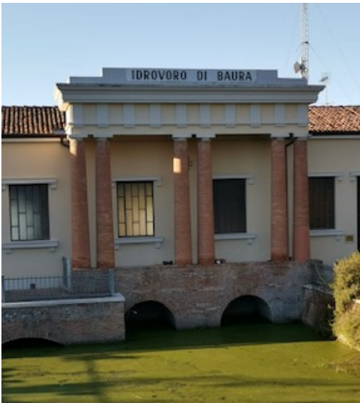
L' Idrovo sulle acque del Po

Finita la sosta golosa, si torna al battello e ci si avvia verso Baura, dove si scende nei pressi dell'Idrovo. In bicicletta o a piedi e ci si incammina verso il centro del paese per arrivare al Fienile. Una bella struttura, inserita in un contesto agricolo, gestita dalla Cooperativa Sociale Integrazione Lavoro. Qui si svolgono diverse attività tra cui la produzione e vendita di pasta fresca, confetture, conserve, succhi di frutta, oggetti artigianali e corsi di cucina. Ci sono laboratori per imparare a fare la classica "coppia ferrarese", il tipico pane IGP (Indicazione Geografica Protetta). Oppure abili sfoglino vi insegneranno a impastare i cappellacci alla zucca secondo la ricetta tradizionale. Il Fienile di Baura si propone anche come luogo per eventi: cerimonie, seminari e corsi. Siamo a soli 8 km da Ferrara e il tramonto vi accompagna sulla via del ritorno.