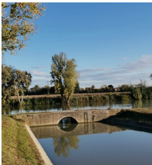
Lungo il percorso del Po di Volano

In perfetta osservanza delle normative anti Covid-19, l'itinerario permette il distanziamento sociale in barca, nei punti di ristoro con la possibilità di igienizzarsi le mani, utilizzo di mascherine e guanti monouso durante i laboratori gastronomici.