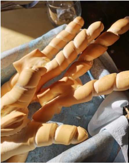
La "coppia ferrarese", il tipico pane IGP (Indicazione Geografica Protetta)

Pedalandosi si arriva al ristorante "La Paradora", una locanda dagli arredi rustici, con un ampio spazio esterno dove gustare i piatti del territorio. Il menu varia seguendo il ritmo delle stagioni. Nel periodo autunnale come primi vengono proposti i cappellacci di zucca al ragù e i cappelletti in brodo. Tra i secondi, rane fritte con verdure, polenta e stracotto, salama da sugo e purè di patate.