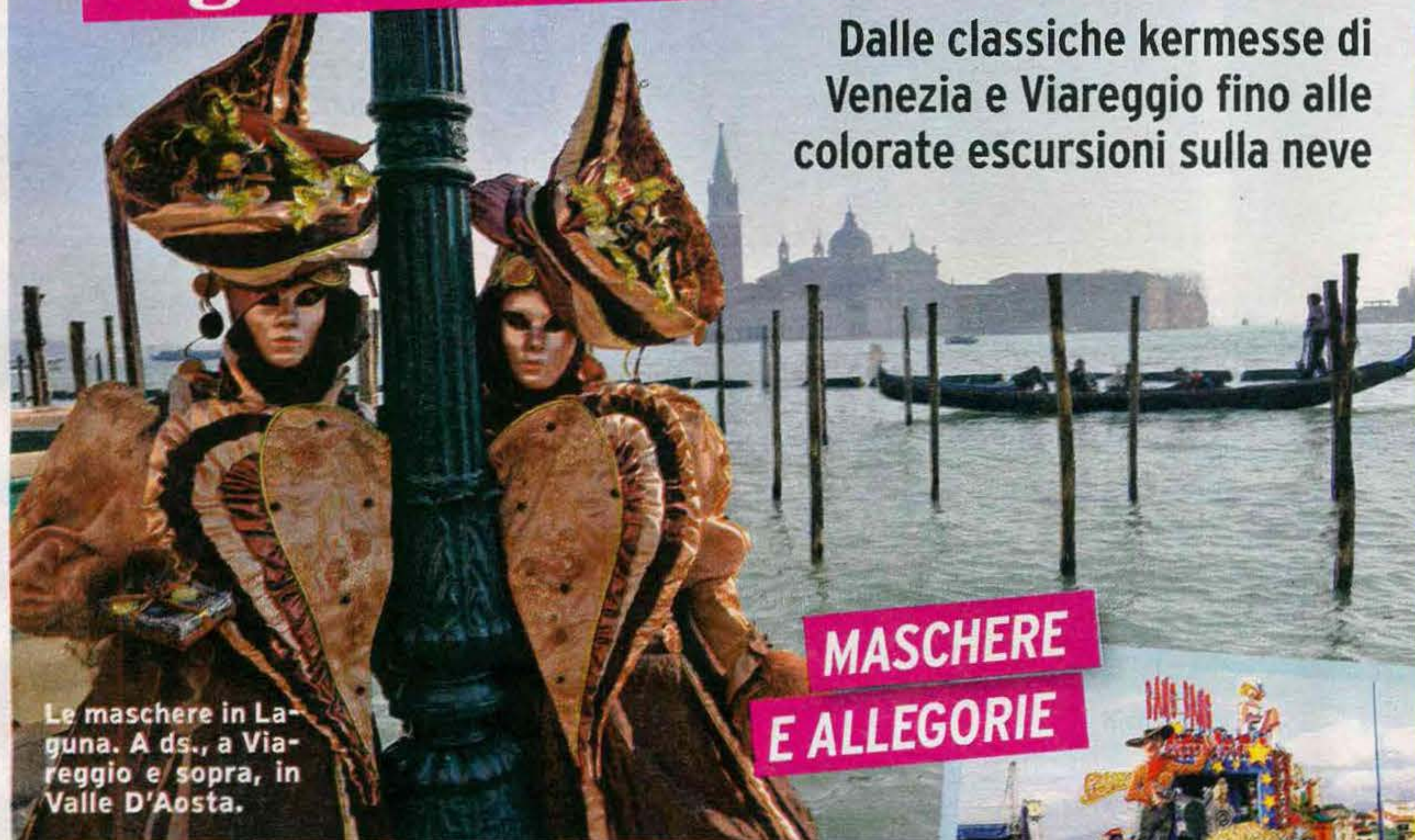
Le maschere in Laguna. A ds., a Viareggio e sopra, in Valle D'Aosta.

Dalle classiche kermesse di Venezia e Viareggio fino alle colorate escursioni sulla neve