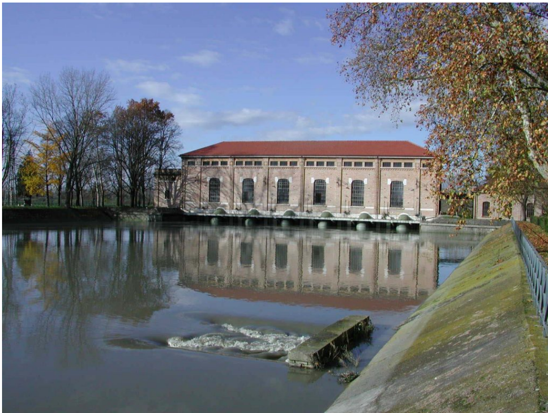
Consorzio Visit Ferrara

Il Museo della Bonifica è stato realizzato nell'impianto idrovoro, un esempio di archeologia industriale inserito nel contesto di edifici in stile liberty, utile per il sollevamento e lo scarico delle acque nel fiume Reno. Qui c'è anche un'antica centrale termoelettrica con immagini che raccontano i lavori di bonifica, le caldaie per produrre il vapore e strumenti più moderni. All'interno della chiesa di San Domenico c'è invece il Museo Civico di Argenta, esempio di architettura quattrocentesca con mattoni a vista e con un campanile con guglia in mattonelle di terracotta policroma.