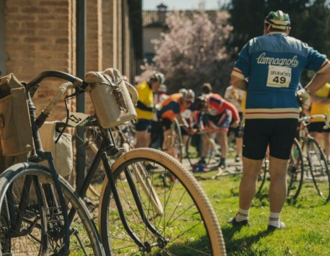
Granfondo del Po

Granfondo del Po e La Furiosa. Amanti delle biciclette questi appuntamenti sono per voi. Il 13 settembre 2020 la gara ciclistica che segue il corso del Grande Fiume. È una gara che si svolge totalmente in pianura. Da Ferrara , la competizione ciclistica segue il corso del Grande Fiume . Due i percorsi , uno corto di 85 km e l'altro di 132 km, che si snoderanno dal Castello Estense per attraversare il lato sinistro del Po e percorrere una delle ciclovie più lunghe d'Italia. Lungo un itinerario che toccherà i comuni di Ferrara, Riva del Po, Copparo, Mesola, per poi passare sulla sommità arginale del fiume della provincia di Rovigo e tornare nella città estense. Il Consorzio Visit Ferrara propone servizi e ospitalità bike friendly, nonché tour guidati per cicloturisti: Sabato 12 settembre è in programma la ciclostorica "La Furiosa" pedalando su bici d'epoca tra le campagne ferraresi e le Delizie degli Estensi, con arrivo nel Castello Estense. Sarà allestito un punto ristoro alla Delizia del Belriguardo a Voghiera . Pasta party finale in ristorante. Un'occasione imperdibile per un week-end nella città degli Estensi.