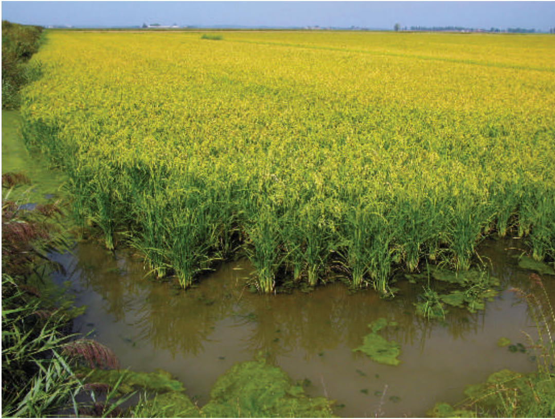
Risaia Azienda Agricola Cerutti

A Bondeno visitiamo la storica azienda Molino Guerzoni William , che da quasi 50 anni produce farine tipo 0 e 00, utilizzando solo grano tenero della pianura Alto Ferrarese: una farina 100% italiana, semplice e naturale, lavorata secondo la tradizione.