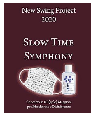
La copertina del volume

La poesia al tempo del Covid-19 nel progetto interclassista 1R, 3T, 4BM "New Swing Symphony-Notes on notes" presentato dall'Istituto comprensivo Copernico Carpeggiani, conquista il terzo premio al concorso internazionale di Poesia e Teatro Castello di Duino, giunto alla sua XVII edizione. Diciannove studenti hanno raccontato storie e cercato ascolto senza dimenticare la funzionalità dei diversi ambiti della comunica-