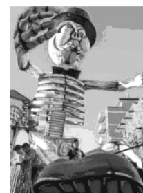
Le regate di Cesenatico, il carnevale di Gambettola e il festival di Cattolica

della società verso il cibo e l'alimentazione", appuntamenti a cura dell'artista. Per l'occasione, viale Ceccarini, Piazzale Roma, viale Dante e il ponte sul portocanale si trasformano in salotti a cielo aperto con allestimenti green, installazioni botaniche e spazi espositivi.