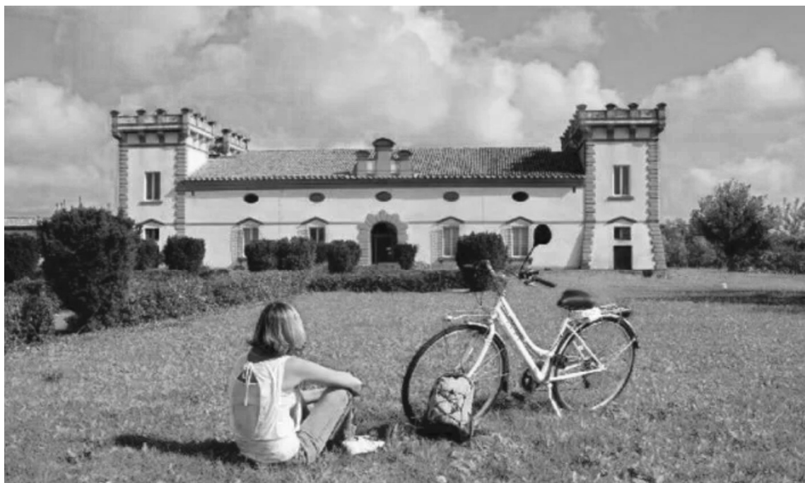
Anello del Rinascimento

percorso, dopo la sosta presso “Lucciole nella Nebbia”, prosegue con una suggestiva navigazione viale sul Po Grande da Stellata di Bondeno alla Darsena di Ferrara, passando per la chiusa di Stelagoscuero. L'Anello del Grande Fiume di svolgerà domenica 6 ottobre e sabato 2 novembre 2024.