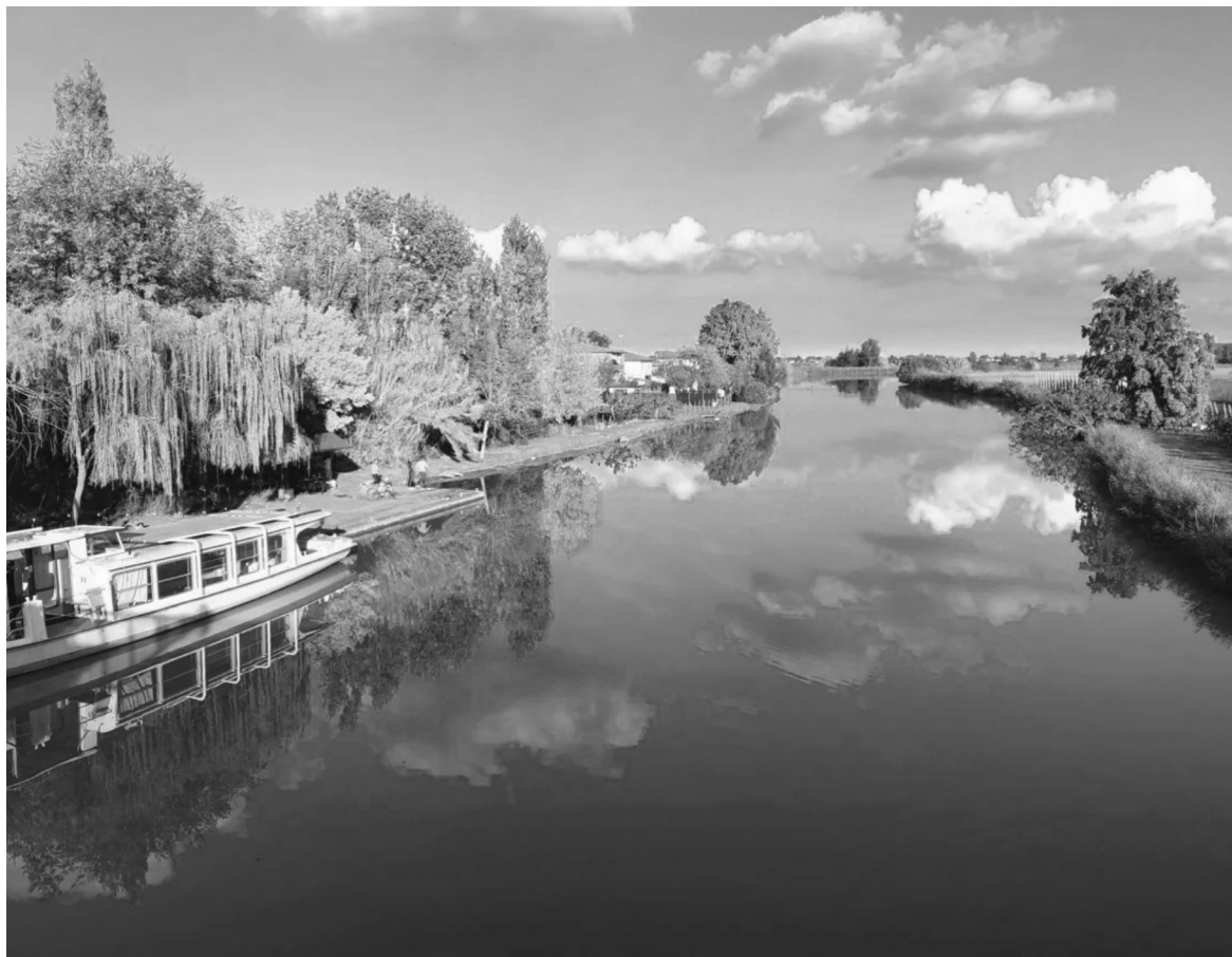
Attracco di Sabbioncello San Vittore