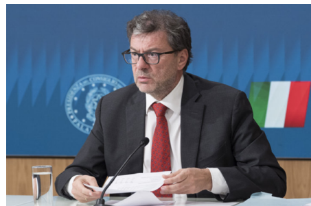
Giorgetti pronto a lasciare il Mef per Bruxelles. Salvini: "Solo fantasie"

falco di palude, la poiana. L'obiettivo è far convivere turismo e natura. Qui c'è anche l'osservatorio astronomico più basso d'Italia (quattro metri sotto il livello del mare) e le stelle si vedono bene, sia per la carenza di inquinamento luminoso, sia perché la sera, da giugno a settembre, c'è brezza e il cielo è pulito. Proprio per omaggiare le stelle, nella valle tanti artisti hanno creato sculture dedicate appunto all'astronomia.