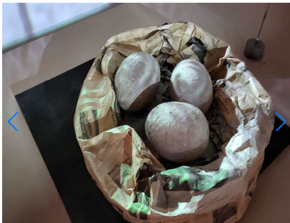
Museo delle Valli – (Foto © Luciano Monteleone)

Situato nel cuore della provincia di Ferrara, il Museo delle Valli di Argenta offre un viaggio affascinante attraverso la storia, la natura e la cultura del territorio vallivo del Delta del Po. Il centro espositivo è un punto di riferimento per chi desidera approfondire la conoscenza degli ecosistemi delle zone umide, patrimonio naturalistico . Attraverso percorsi interattivi, collezioni di reperti e mostre temporanee, il museo racconta la millenaria interazione tra l'uomo e l'ambiente, mettendo in luce le tradizioni locali e le trasformazioni del paesaggio. Meta imperdibile per gli amanti della natura e della storia, che offre, ad ogni visitatore, anche opportunità di escursioni guidate nei dintorni.