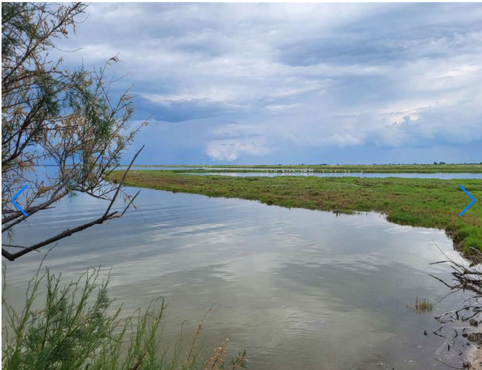
Oasi di Boscoforte – (Foto © Luciano Monteleone)

L'Oasi non è solo un rifugio per i cavalli, ma ospita anche una ricca varietà di flora e fauna. Gli appassionati di birdwatching possono avvistare numerose specie di uccelli migratori, tra cui fenicotteri, aironi e anatre. Le escursioni nell'Oasi, organizzate con guide esperte, permettono di scoprire la complessità e la bellezza di questo ecosistema unico, offrendo una prospettiva privilegiata sulla biodiversità del Delta del Po .