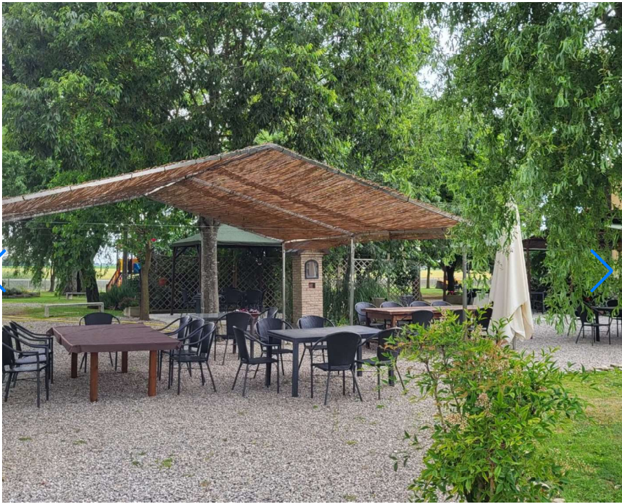
Parco Agriturismo Vallesanta