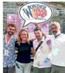
Tre momenti di domenica, prima serata di Wonder Gulp Festival. La manifestazione proseguirà fino al 7 settembre con iniziative diverse